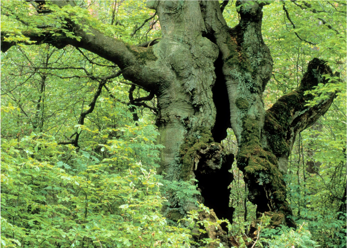
Alte Wälder sind reich an Arten, sie speichern sehr viel Kohlenstoff und bieten ein urtümliches Naturerlebnis.

Urtümliche Buchenwälder sind in Deutschland rar geworden. Umso wichtiger ist es, diese Naturparadiese zu bewahren. Sie schützen das Klima, sind die Heimat vieler bedrohter Tier-, Pflanzen- und Pilzarten und Erholungsorte für uns Menschen. Greenpeace fordert ein großflächiges Netzwerk geschützter naturnaher Buchenwälder.