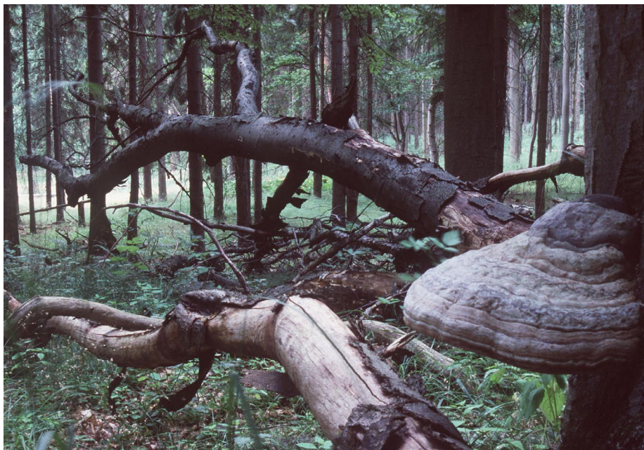
Totholz spendet Leben: Jeder sterbende Baum im Wald ist die Heimat zum Beispiel von Moosen, Käfern und Pilzen.