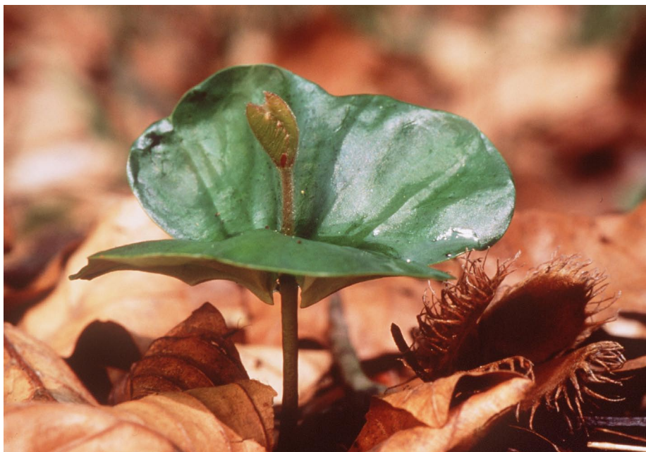
Mit Glück wird aus dem kleinen Buchensämling einmal ein Baumriese – von bis zu 45 Metern Höhe.

Wäre der Raubbau so rasant weitergegangen, wäre Deutschland heute eine Wüste. Stattdessen begann man, wieder aufzuforsten. Doch statt auf heimische Laubbaumarten zu setzen, wurden schnell wachsende Nadelbäume gepflanzt, die noch heute – meist in Monokultur – große Waldgebiete Deutschlands ausmachen: Fichten zu rund 28 Prozent, Kiefern zu 23 Prozent.